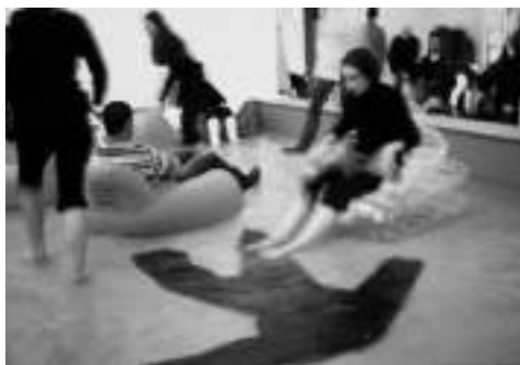
AUTO PORTRAIT À LA CRIÉE, 2001 PHOTO-TÉMOIGNAGE D'HERVÉ THOBY

Le terme de « baigneur » s'entend aussi au sens figuré : on songe à un bain commun, un espace-substance qui nous relie. On y retrouve l'imaginaire de l'eau et de la Plongée (nom qu'elle donne à chacun des dix rendez-vous qui se tiennent à la Gaîté lyrique en 2013-2014), autrement dit une forme d'immersion commune. Catherine Contour dit des spectateurs qu'ils glissent : « Ils se glissent ensemble dans une expérience esthétique intime et collective, avec et pour le lieu. » La relation est pensée sans heurts. Si la glissade, on le sait, est favorisée par la nature de l'environnement (qui peut être visqueux, aqueux, huileux, coulant, autant de textures que l'artiste affectionne), le geste du glisser est aussi propice aux évocations spectrales ou sensuelles. Ce glisser invite à penser la contagion : kinesthésique, physique, émotionnelle. Le lien serait fluide, liquide, propice à la trans-