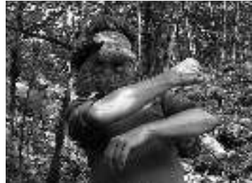
SUR AUTO PORTRAIT AUX JARDINS DE BARBIREY, 2003-2004 VIDÉO, 56 MIN., COULEUR, SON

Dans tous les cas, on décèle un principe de contamination avec l'environnement qui tient aussi du camouflage, surtout lorsque l'immobilité s'installe. Les couleurs se confondent – verts de la mousse et vert du pull, blancheur et lumière des rochers et de la peau. La danseuse se fait de l'étoffe même du monde, comme dirait Maurice Merleau-Ponty. C'est par contact direct que la métamorphose s'opère, comme si éprouver la mousse à même la peau transformait la texture même du corps, et entraînait soudain le buste dans une horizontalité que le poids du masque végétal aurait déclenchée. C'est bien dans l'expérimentation de ces formes et matières que l'image se construit mais aussi que le geste surgit... La danseuse, alors, peut s'éloigner de la caméra et explorer davantage la sensation et le mouvement.