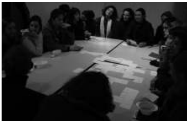
UNE PLAGE AU CHÂTEAU DE LA ROCHE-GUYON, 2008