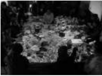
UNE PLAGE AU CHÂTEAU DE LA ROCHE-GUYON, 2008