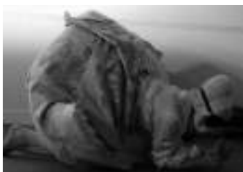
AUTO PORTRAIT À LA CRIÉE, 2001 PHOTO-TÉMOIGNAGE D'AGNÈS DAHAN