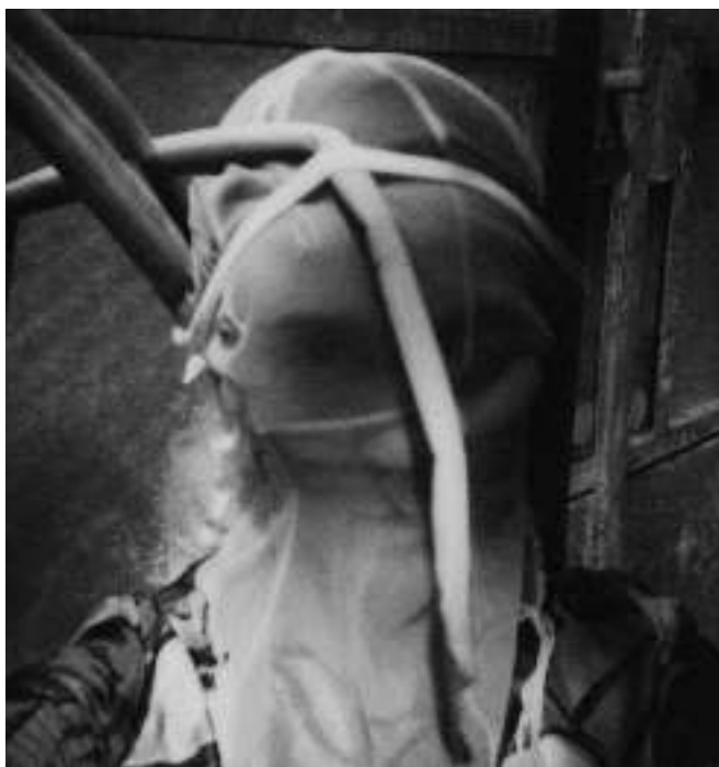
AUTO PORTRAIT À DIJON N° 1, 2005 TIRAGE D'APRÈS POLAROÏD

Le jardin n'est donc pas qu'une eutopie – du grec eú (« bien, harmonie, justesse ») et tópos (« lieu »). L'historien du jardin Hervé Brunon nomme ainsi le sentiment de bien-être que le jardin peut procurer ou le pouvoir d'attraction qu'il suscite 11 . Le jardin est également ici le lieu d'expériences obscures, toxiques, comme le suggère l'ingestion des végétaux. L'humain y éprouve les limites de sa propre résistance. La peau s'irrite lorsque s'y incruste trop de terre, d'insectes, de mousse... Des protections s'imposent, telles la tête et les bras de tulle blanc créés par Christian Rizzo en 1997 pour Autoportrait avec vaches 12 . Ce tulle qui peut encore à Barbirey protéger le corps ou le visage, évidemment, donne à Catherine Contour un aspect spectral.