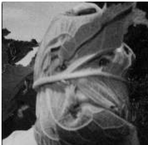
AUTO PORTRAIT À BARBIREY N° 10, 2003 TIRAGE D'APRÈS POLAROID