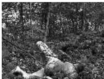
SUR AUTO PORTRAIT AUX JARDINS DE BARBIREY, 2003-2004 VIDÉO, 56 MIN., COULEUR, SON