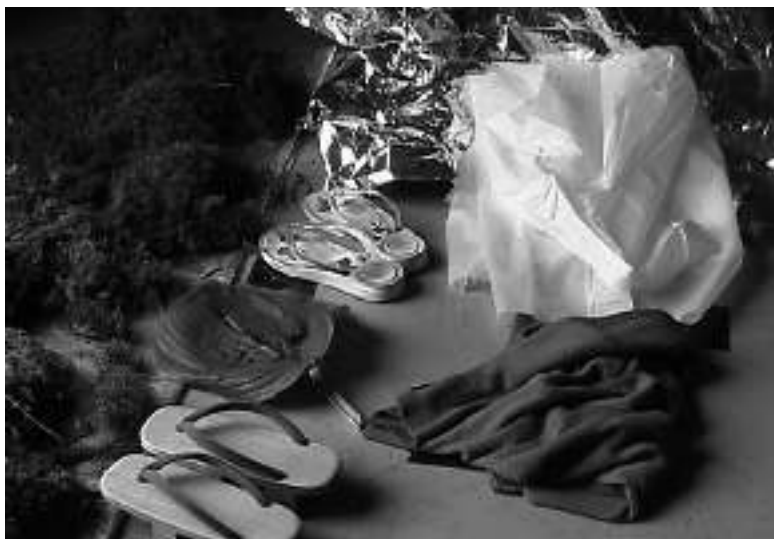
SUR AUTO PORTRAIT AUX JARDINS DE BARBIREY, 2003-2004 VIDÉO, 56 MIN., COULEUR, SON