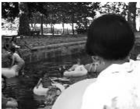
AUTO PORTRAIT À CASTRIES, 2006 PHOTOGRAMME D'UN FILM-TÉMOIGNAGE