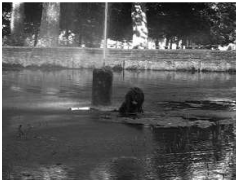
AUTO PORTRAIT À CASTRIES, 2006 PHOTOGRAMME D'UN FILM-TÉMOIGNAGE

Si Catherine Contour partage avec d'autres artistes certaines des dénominations précédentes pour décrire le public, elle est probablement la seule à parler de « baigneurs ». Elle laisse parfois croire qu'il faut l'entendre au sens propre, non seulement parce qu'il lui arrive de s'immerger littéralement, mais aussi parce que l'eau peut réellement devenir le milieu dans lequel des spectateurs-baigneurs flottent.