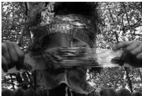
SUR AUTO PORTRAIT AUX JARDINS DE BARBIREY, 2003-2004 VIDÉO, 56 MIN., COULEUR, SON