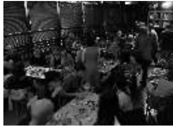
UNE PLAGE À PONT-DE-CLAIX, 2012