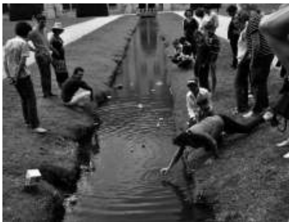
UNE PLAGE À ROYAUMONT, 2012

Dans tous ces cas, le joueur est invité à participer visiblement, à proposer. Cela rappelle certaines performances des années 1960 ou bien cet art des années 1990 que Nicolas Bourriaud a regroupé sous le terme d'« esthétique relationnelle », insistant sur le caractère d'un art « dont l'intersubjectivité forme le substrat et qui prend pour thème central l'être-ensemble, la rencontre, l'élaboration collective du sens 4 . » Il s'agit de « constituer des modes d'existence ou des modèles d'action