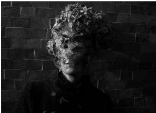
AUTO PORTRAIT AU BOIS DES MOUTIERS N° 3C, 2008