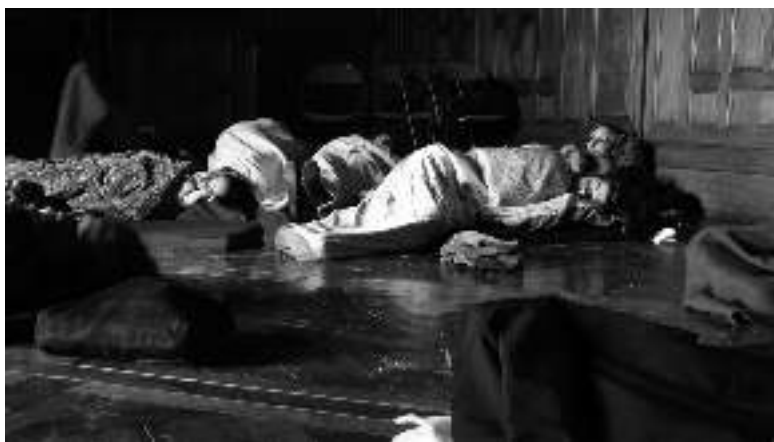
UNE PLAGE AU CHÂTEAU DE LA ROCHE-GUYON, 2008 PHOTO-TÉMOIGNAGE DE PHILIPPE BISSIÈRES